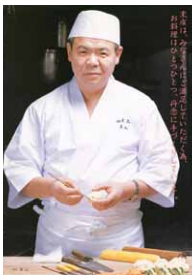
味の匠として腕をふるっていた頃のなつかしい姿…