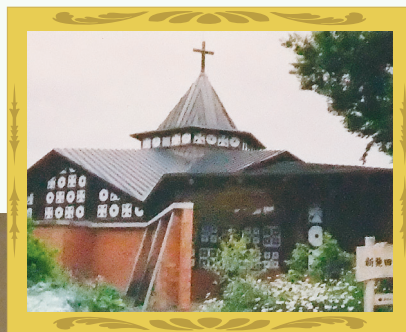
アントニン・レーモンド設計