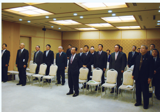
国歌、並びにライオンズクラブの歌 斉唱